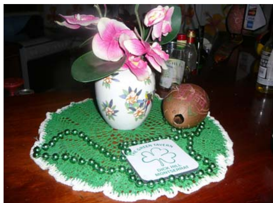
San Patricio caribeño

Copyright (c) 2010 by Rosana Herrero-Martín. This text may be archived and redistributed both in electronic form and in hard copy, provided that the author and journal are properly cited and no fee is charged for access.